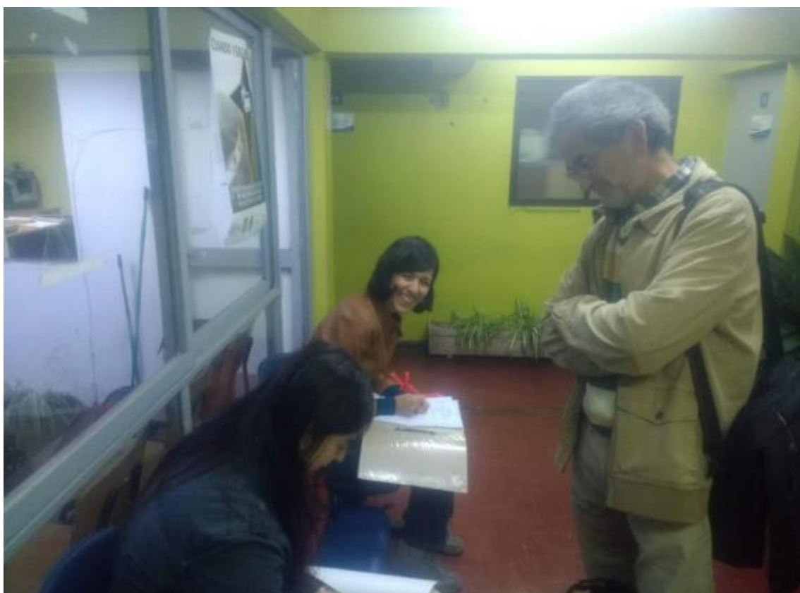
Figura 1 y 2. Asistencia a firma de constitución de la organización.