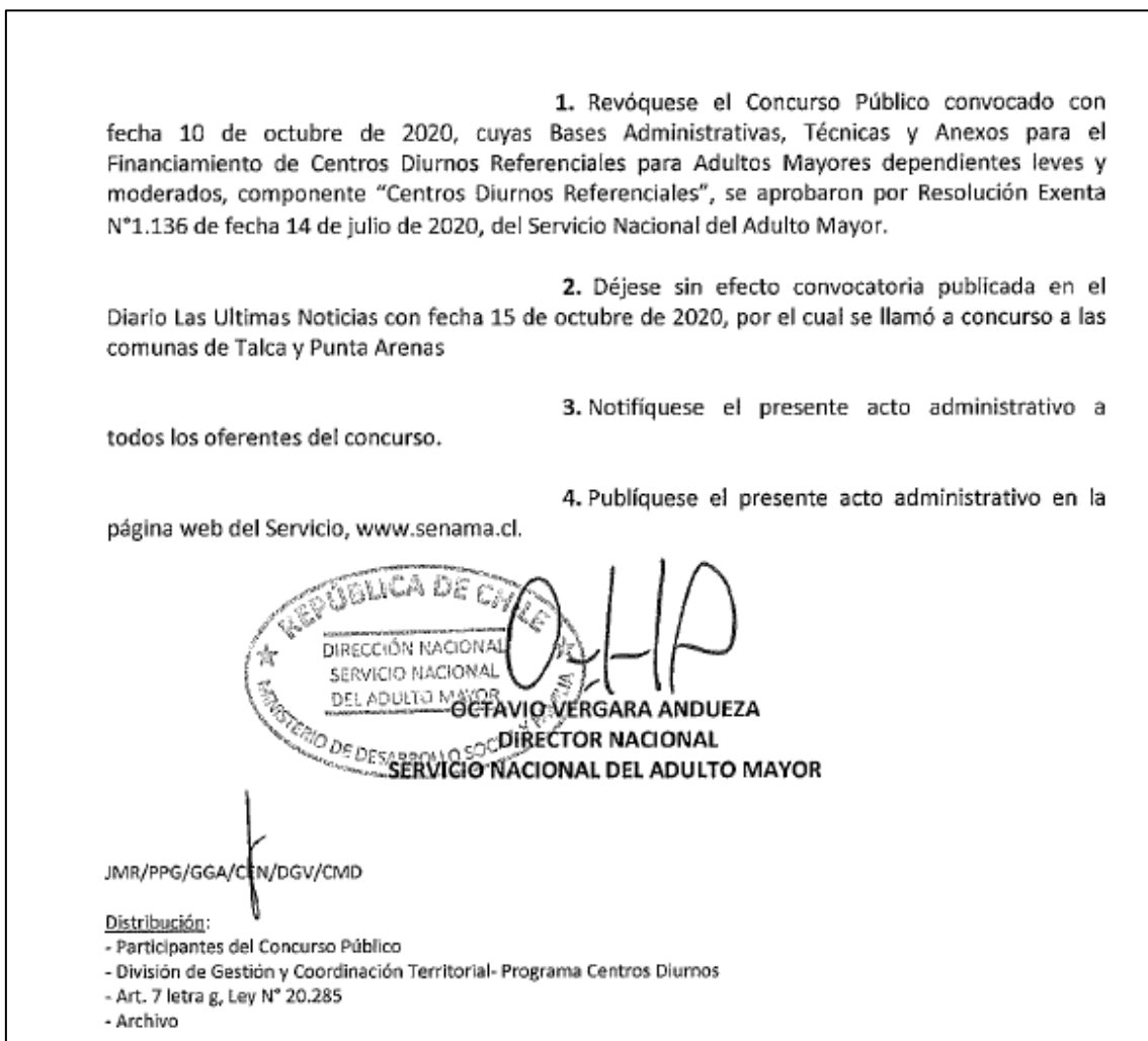
Figura 6. Extracto de resolución recibida informando convocatoria sin efecto.