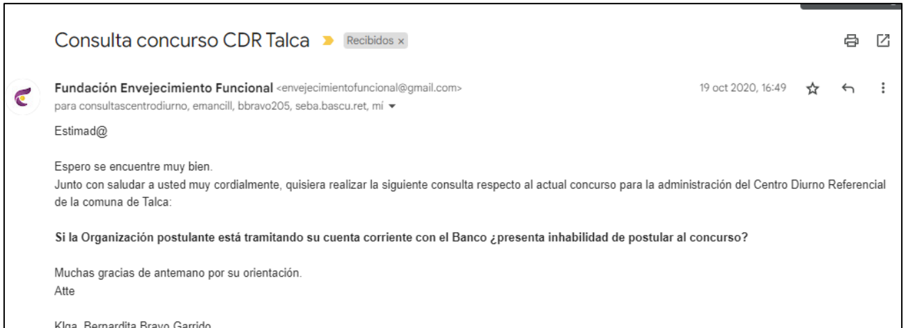
Figura 1. Correo con consulta para postular a concurso.